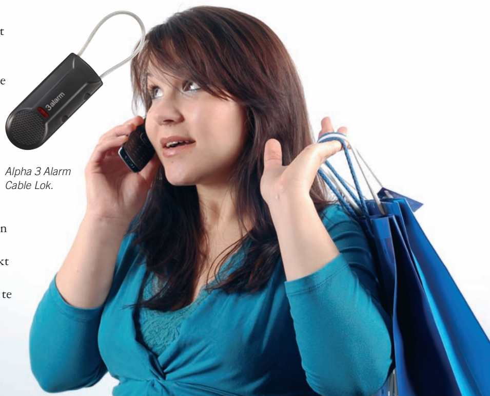
Alpha 3 Alarm Cable Lok.

“ De Alpha beveiligingstags bij Jades hebben een systeem vervangen, dat esthetisch niet paste bij onze zeer modieuze designer artikelen. ”