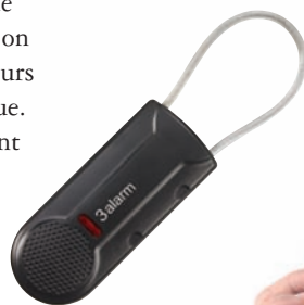
Cable Lok Alpha 3 Alarm.

“ Les macarons Alpha ont remplacé chez Jades un système qui n'allait pas très bien esthétiquement avec nos articles haute couture. ”