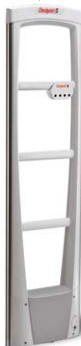
Antenna EVOLVE P10 con l'unità EVOLVE VisiPlus™ integrata.

Il sistema EVOLVE, così come suggerisce il nome, è stato ideato per evolvere insieme al negozio. Questa piattaforma altamente flessibile, garantisce un percorso di potenziamento, con nuove funzionalità come la tecnologia RFID, l'operatività in rete, l'individuazione delle "booster bags" (borse da taccheggio) e la semplice integrazione con altri sistemi di prevenzione.