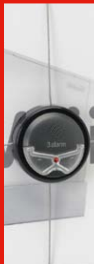
Soluzioni per merce ad alto rischio di furto