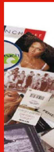
Etichette per capi di abbigliamento