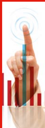
Software di gestione delle differenze inventariali