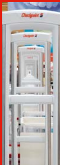
Electronic Article Surveillance (EAS)

Checkpoint Systems è il fornitore leader di soluzioni per la gestione delle differenze inventariali. Il team di Checkpoint collabora a livello globale con i retailer per ridurre i furti, raggiungere l'eccellenza operativa, aumentare la visibilità inventariale e garantire ai clienti una maggiore disponibilità di merce attraverso la combinazione di una tecnologia RF avanzata, un programma integrato di protezione della merce, diversi software di gestione e soluzioni di etichettatura in tempo reale.