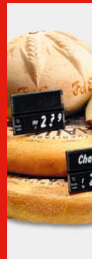
Soluzioni per la comunicazione e promozione nel punto vendita