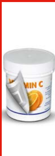
Protezione alla fonte