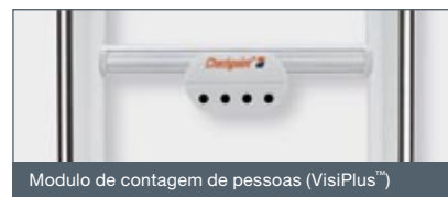
Módulo de contagem de pessoas (VisiPlus™)

As antenas EVOLVE P vêm acompanhadas por uma vasta gama de acessórios, tais como painéis promocionais, painéis de segurança, protecções de antenas, escudos exteriores e módulo contador de visitantes (VisiPlus™).