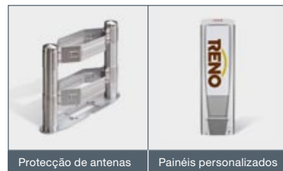
Protecção de antenas